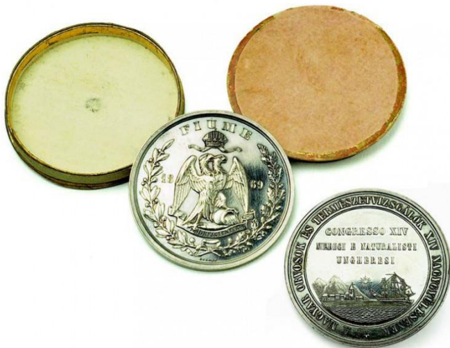
W. Seidan, Medalja 14. Kongresa liječnika i prirodoslovaca Ugarske, Budimpešta 1869., PPMHP 103278 / W. Seidan, Medal of the 14 th Congress of Doctors and Natural Historians of Hungary, Budapest 1896., PPHMP 103278