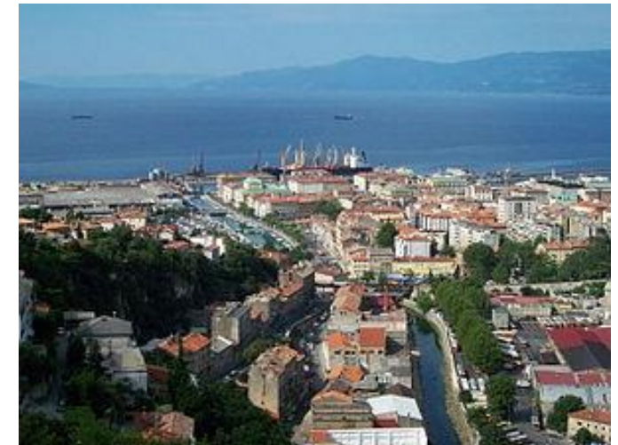
Grad Rijeka danas. / The City of Rijeka today.